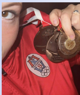
VICTORIA, kl. 4

Mamy szkołę wieczorową, która funkcjonuje od godziny 14.00 do 20.00 w poniedziałki, wtorki i czwartki. A także szkołę zaoczną, której słuchacze spotykają się co dwa tygodnie w soboty i niedziele od rana do godziny 16.