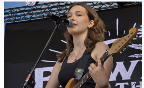
MILENA, „FLOWERS ON THE MOON” Debiut zespołu na dużej scenie Dni Trzebini 2025

Powiatowy Młodzieżowy Dom Kultury w Trzebini, ul. Kościuszki 72