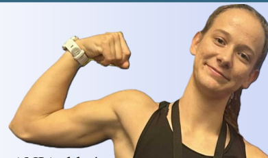
ANIA, kl. 4

Wybierając nas, stawiasz na praktyczne kierunki zgodne z oczekiwaniami pracodawców . Kształcimy ludzi, którzy dobrze zarabiają, realizują swoje pasje i odnoszą sukcesy zawodowe . U nas nie będziesz się nudzić! Rozbudzimy Twoją ciekawość, pomożemy odkryć talenty i połączymy naukę z Twoimi zainteresowaniami. Po ukończeniu naszej szkoły masz konkretny zawód, jesteś samodzielny i gotowy do dorosłego życia .