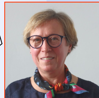
Dyrektor LO dla Dorosłych

Jesteśmy szkołą drugiej szansy. Dajemy wszystkim czystą kartę. Jeśli tylko zechcą, mają u nas okazję zacząć wszystko od nowa. Nie możemy patrzeć na to, co się w ich życiu wydarzyło wcześniej. Idea tej szkoły jest taka, żeby ich wspierać i by czuli się u nas dobrze.